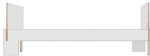
mit Kopf- und Fußteil/with head - and footboard